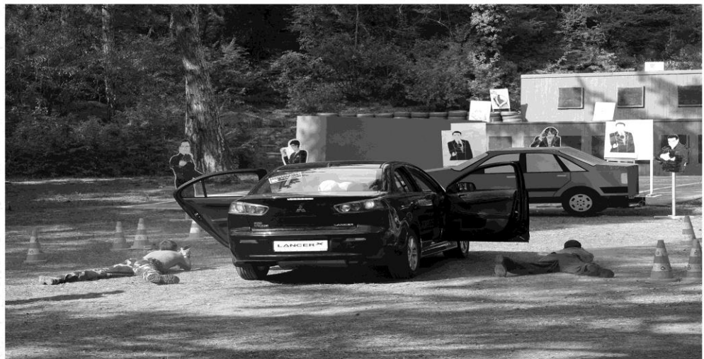
Вариант стрельбы из-за автомобиля